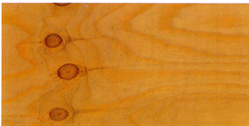
CONTRE - FACE

QUELQUES BOUCHONS CONFECTIONNÉS EN BOIS DE MÊME APPARENCE QUE LA FACE.